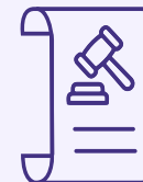
A partir de las Políticas Públicas.